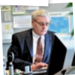
Médico de Família